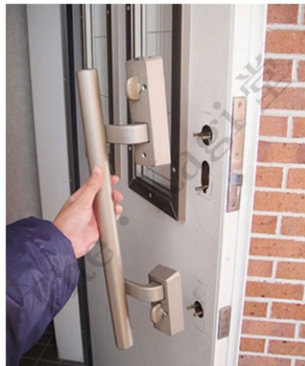
7. 室内ハンドルが外れます。引抜く際は、室外ハンドルが落ちないように注意しましょう。