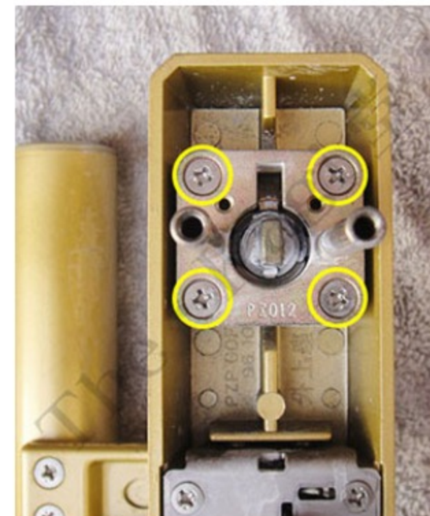
9. シリンダーを外していきます。図は、外した室外ハンドルの裏側の上部です。黄丸部分の4か所の固定ネジをプラスドライバーで外していきます。