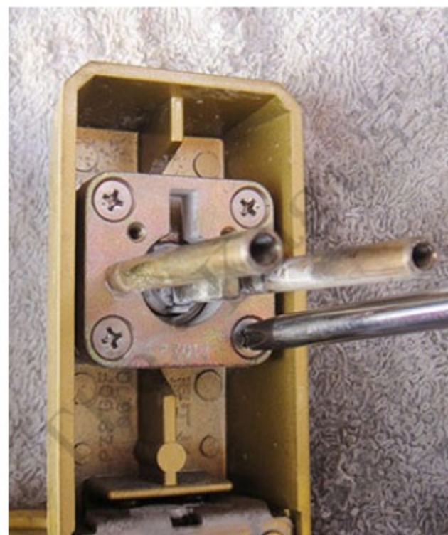
10. 固定ネジは再利用するので、ネジ山を潰さないよう注意しながら外して下さい。