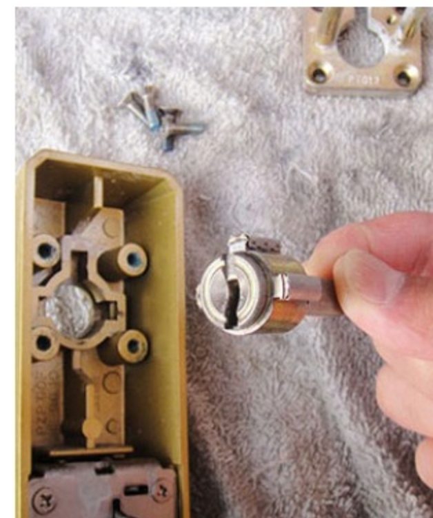
12. 交換用シリンダーと入替え、【手順11～9】の順でシリンダーを固定し押します。下部シリンダーも同様に行い、ハンドルを付直し完了です。