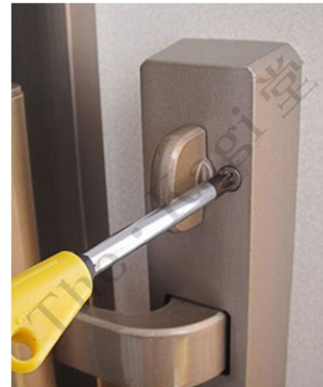
6. プラスドライバーでそれぞれの固定ネジを外します。