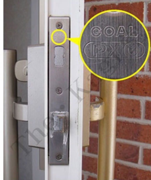
2. まずは、錠前刻印を確認します。開いたドア側面の上部フロントプレートに【GOAL PXG】と刻印されています。