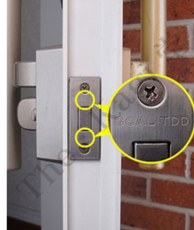
3. 同様に、ドア側面の下部フロントプレートに【GOAL TDD】と刻印されています。上下で【PXG+TDD】の組合せになっていることを確認して下さい。