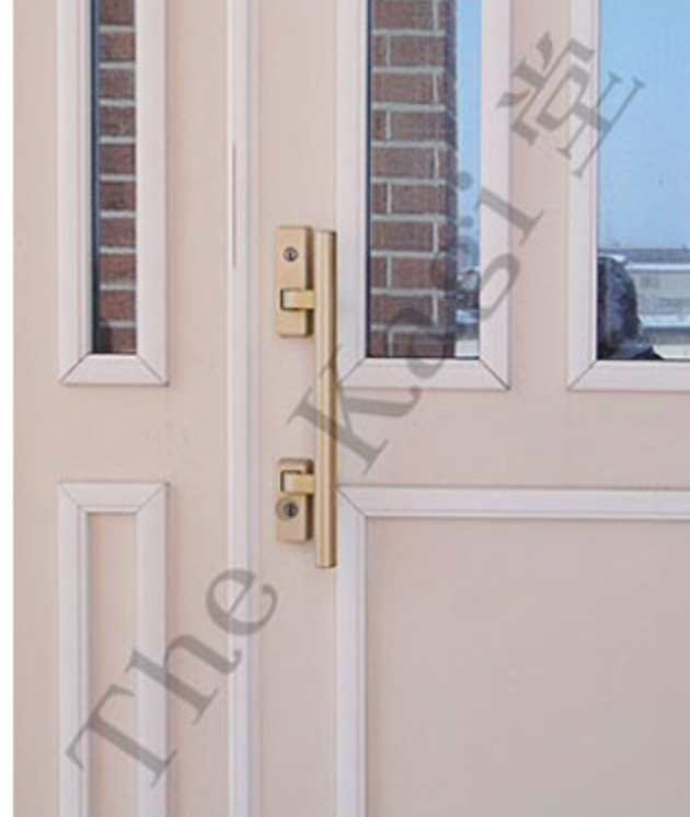
1. 旧立山アルミ製玄関ドア「エスタシア」のシリンダーの交換方法を説明していきます。ドア本体上部に「立山アルミ エスタシア」のマークがあること確認しましょう。