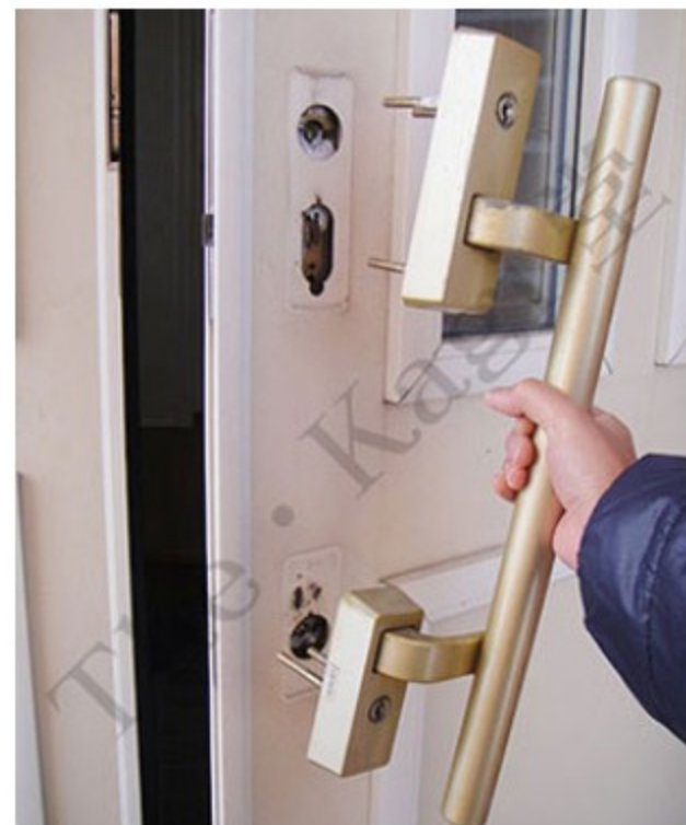
8. 室外ハンドルが外れます。