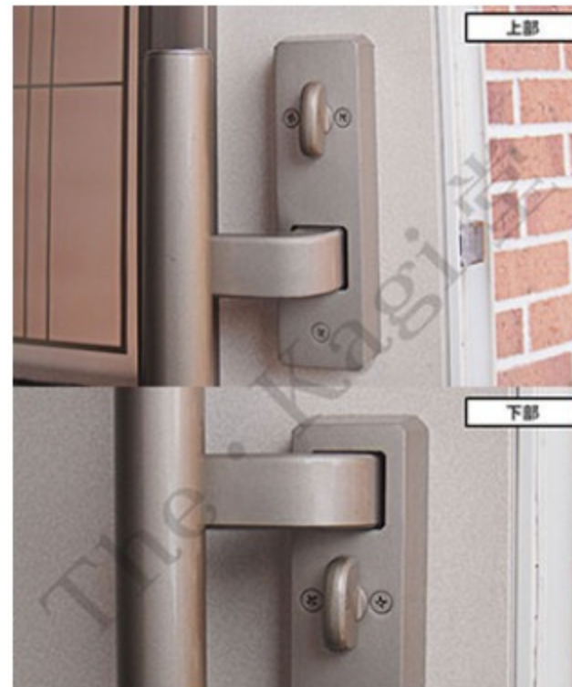
5. 室内ハンドルの上部に3か所、下部2か所の固定ネジがあります。