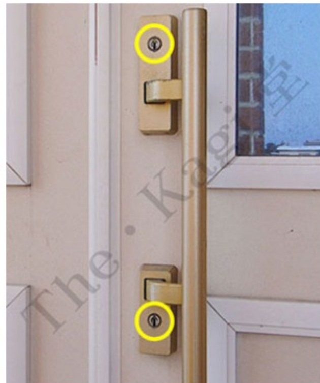
4. 次に、ハンドルを外していきます。図の黄丸部分がシリンダー部分になりますが、ハンドルと一体化しているため、ハンドルを外さないと交換ができません。