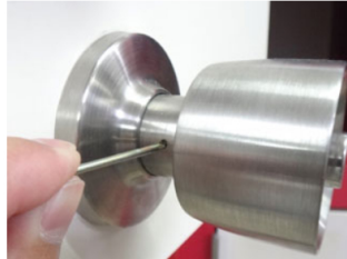
2. まずは、室内側ノブの根本にある小さな穴に、付属の金棒、または、千枚通しなどを「カチッ」と手応えがあるまで挿し込みます。