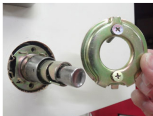
7. 台座の金具部分が外れます。