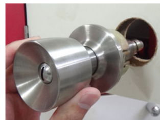
12. 室外側ノブから取付け、室内ノブの台座→台座カバー→室内ノブの順番に付けて完成です。