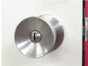
1. 室内ノブとして使用されることの多い、GOAL ULWシリーズのドアノブの外し方を説明します。