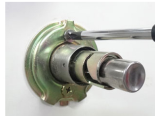
6. さらに、台座の金具部分のネジをプラスドライバーで緩めます。