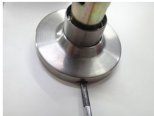
4. 次に、室内側ノブの台座カバーを外していきます。台座下部の隙間に、マイナスドライバーを押し入れ、軽くこじります。