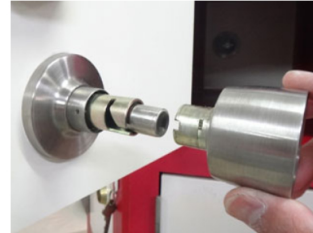
3. 室内側ノブの握り手部分を引っ張ると外れます。