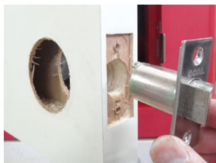
10. ラッチケースが取り出し難い場合は、ドアノブの穴から手で押し出しましょう。