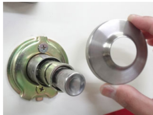
5. 台座カバーが外れます。