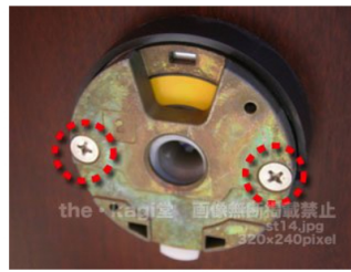
16.ビスを取り外せば画像のように金具の部品が外れます。するとまたビスが2本見えてきます。