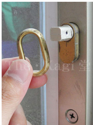
4. さらに、室内サムターンのリングが外れます。