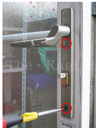
5. 室内ハンドルの赤丸部分2ヶ所の固定ネジをプラスドライバーで外します。