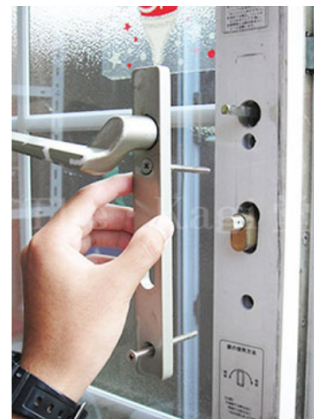
6. 室内ハンドルが引抜けます。引抜く時は、室外ハンドルが落ちない注意しましょう。