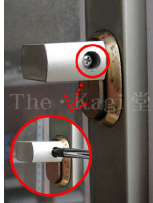
2. まずは、室内ハンドルを外していきます。室内サムターンの固定ネジをプラスドライバーで外します。