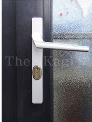
1. エクセルシャノン製シリンダーの交換方法を説明していきます。図は断熱ドア仕様の勝手口に取付けられています。