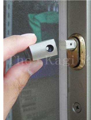
3. 室内サムターンのつまみ部分が外れます。