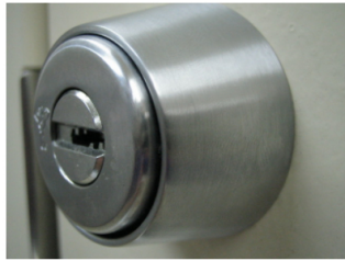
1. 本説明ではMIWA LA用のシリンダーを例に防犯スペーサーの取付けを説明していきます。