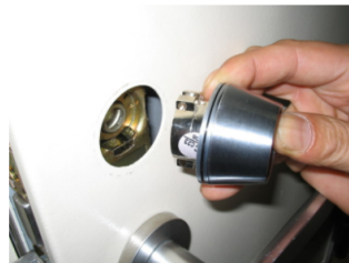
8. スペーサーが落ちないように、押さえながらシリンダーを取付直します。