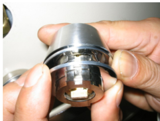
7. 図は2枚のスペーサーが入った状態です。