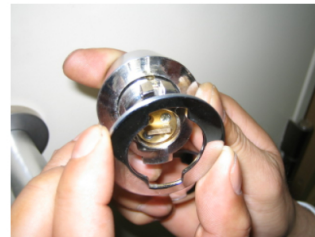
6. 取外したシリンダー本体の裏から【手順5】で用意したスペーサーを通します。