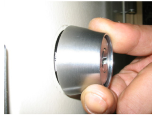
2. シリンダーの周りを覆う部分（シリンダーカラー）を引っ張ると、ドアとシリンダーの間に隙間ができます。