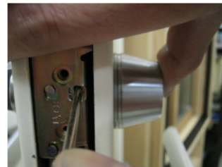
9. シリンダーを外した時とは逆の手順で取付けます。