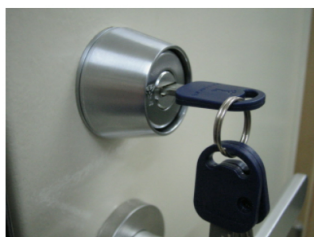
10. 最後に動作を確認して作業終了です。ドアとシリンダーの隙間が埋まりすっきりしました。