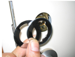
5. 図はシリンダーを外した状態です。隙間が4mmなので、2mmのスペーサーを2枚用意します。