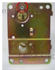
14. ここでは新しくWESTリプレースシリンダーを取り付けます。作業は外し方と逆の手順です。