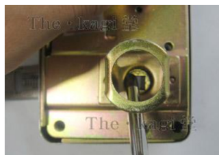
13. 既存の従来品シリンダーが外れました。